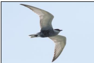
← クロハラアジサシ (2018年8月11日撮影)