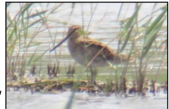
オオジシギ? (2018年8月19日)

8月15日にも500mくらい先でそれらしき鳥を見つけていましたが、今回も200mほど距離があり、きちんと識別するにはまだ遠く、よく分かりませんでした。