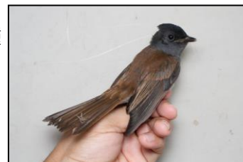
初記録のサンコウチョウ (2018年9月7日)

本来は暗い林の中にいる鳥なので、主にヨシ原である水鳥公園に現れるとは意外でした。