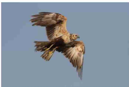
← 足環つきのチュウヒ (左脚に黒いリング「U4」) (2019年1月23日撮影)