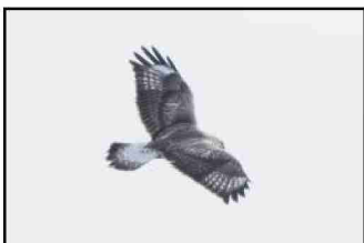
←5シーズンぶりに飛来した ケアシノスリ 2023/1/5 撮影