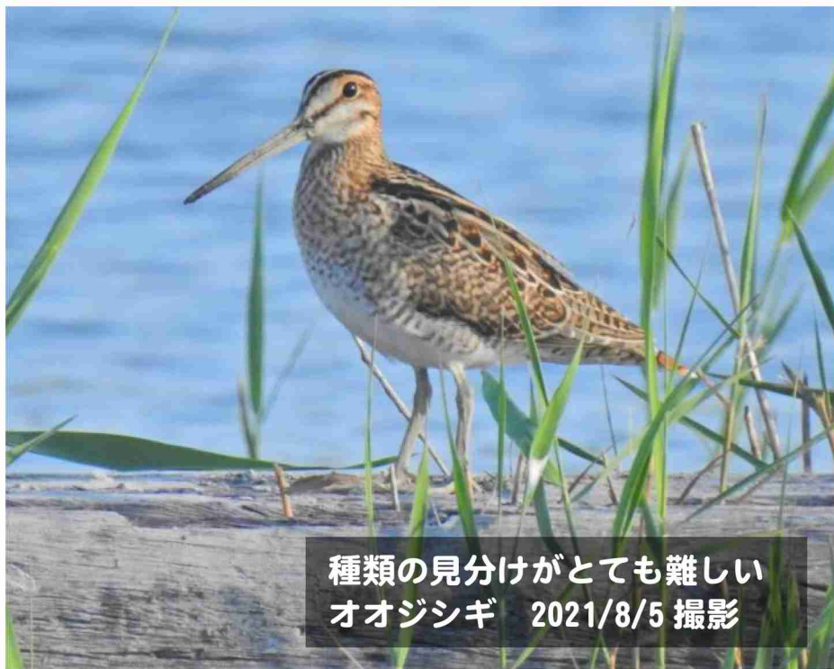
種類の見分けがとても難しい オオジシギ 2021/8/5 撮影