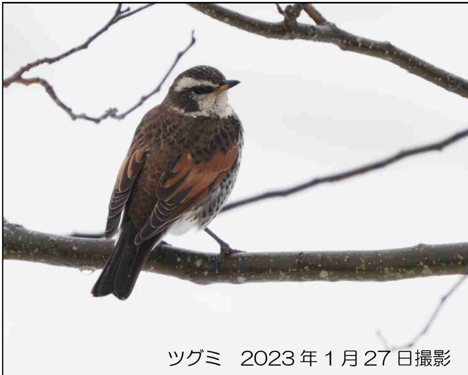
ツグミ 2023年1月27日撮影