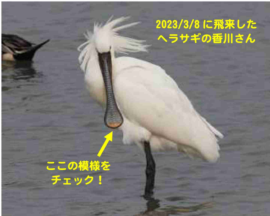
2023/3/8 に飛来した ヘラサギの香川さん