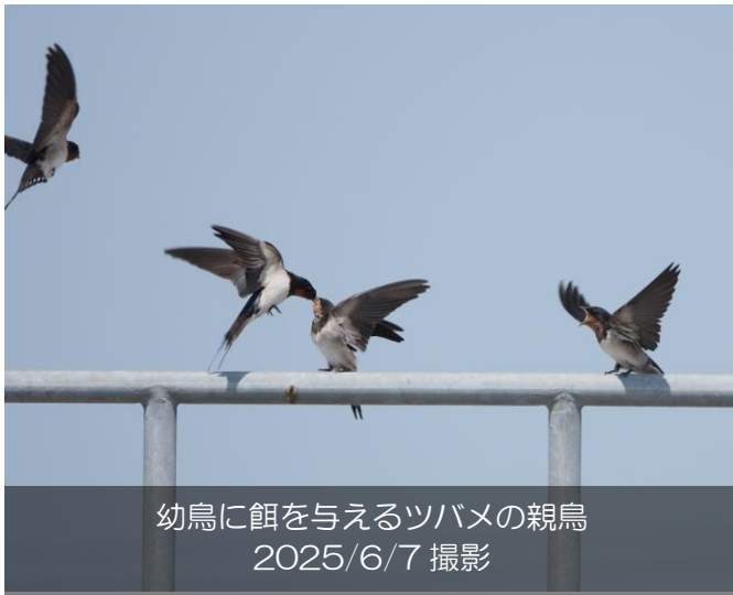
幼鳥に餌を与えるツバメの親鳥 2025/6/7 撮影