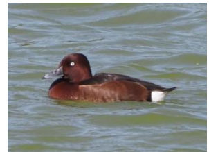
シマアジ 2026/4/11 メジロガモ 2026/4/16