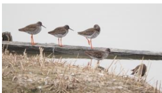
カモ島に集まった アカアシシギ5羽 2026/3/22 撮影